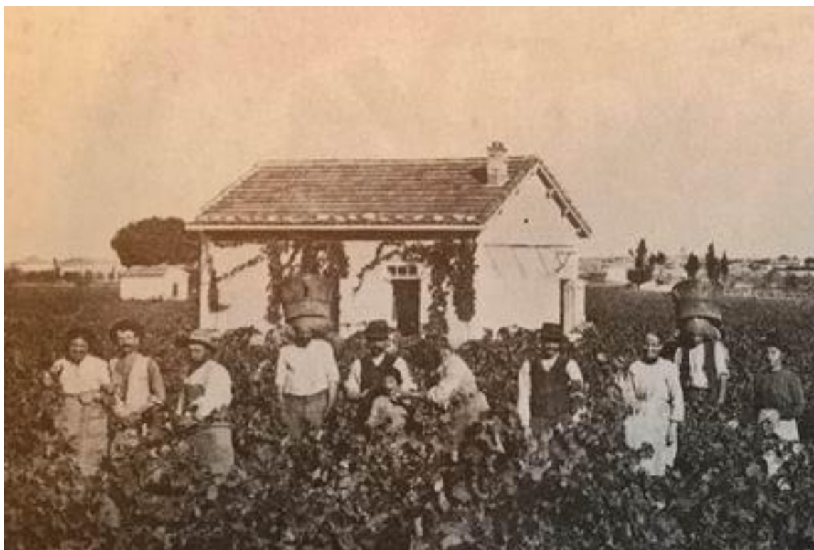
Le maset de Bourry dans les vignes de Malacorade (années 1920)

Vous avez des vieilles photos montrant des scènes traditionnelles, des bâtiments disparus, à Codognan ou dans les environs... contactez nous ! Nous pouvons les numériser et préserver notre patrimoine collectif. Contact : coudougnan30@gmail.com