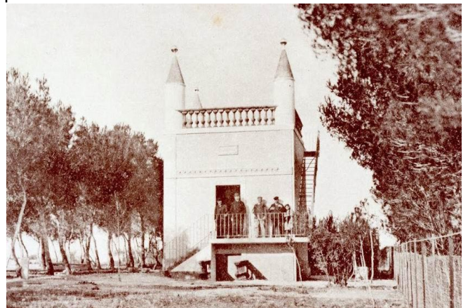
Le maset « La Frigoule » au temps de sa splendeur

Situé à Cante Cigale, la villa « la Frigoule » était surmontée d'une terrasse flanquée de quatre tourelles et couronnée d'une balustrade du plus bel effet, d'où on dominait la plaine en profitant du calme et de l'air pur de la garrigue (c'était avant la construction de l'autoroute !). Un jardinier à temps plein entretenait alors la bâtisse et les abords.