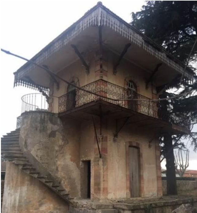
Le « Chalet » la veille de sa démolition

Resté intact depuis sa construction en 1878, il faisait tellement partie du paysage qu'on le croyait éternel, comme figé pour toujours dans son enclos boisé. Il aura suffi d'une journée pour éliminer ce témoin d'un autre âge, maintenant révolu : le temps des masetts.