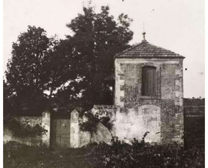
Le maset de Gaufrès ou Villa des tilleuls à Quiquillon